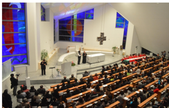
クリスマス市セレモニー